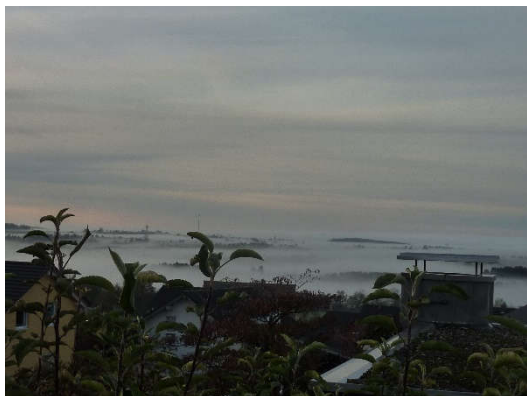
Nebel über Oberiflingen