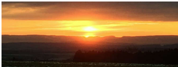
Sonnenaufgang über der Schwäbischen Alb

Schneeschuhwanderung Termin wird rechtzeitig im Blättle bekannt gegeben