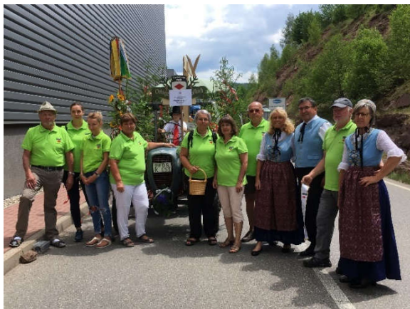
Umzugsgruppe zur 1250-Jahr-Feier in Glatten