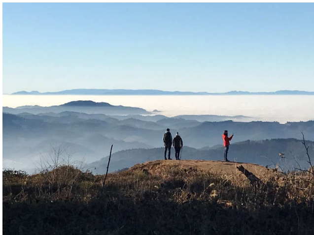
Blick ins Badische vom Buchkopfturm